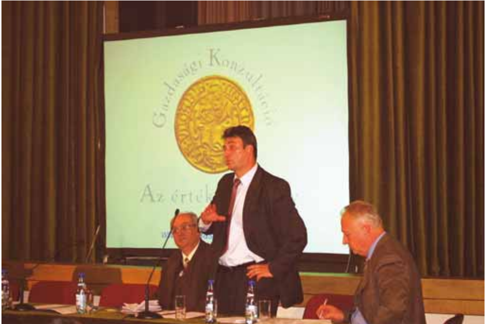
Gazdasági Konzultáció a Kárpát-medencei gazdasági övezetről, Nagyvárad 2005. november 11.