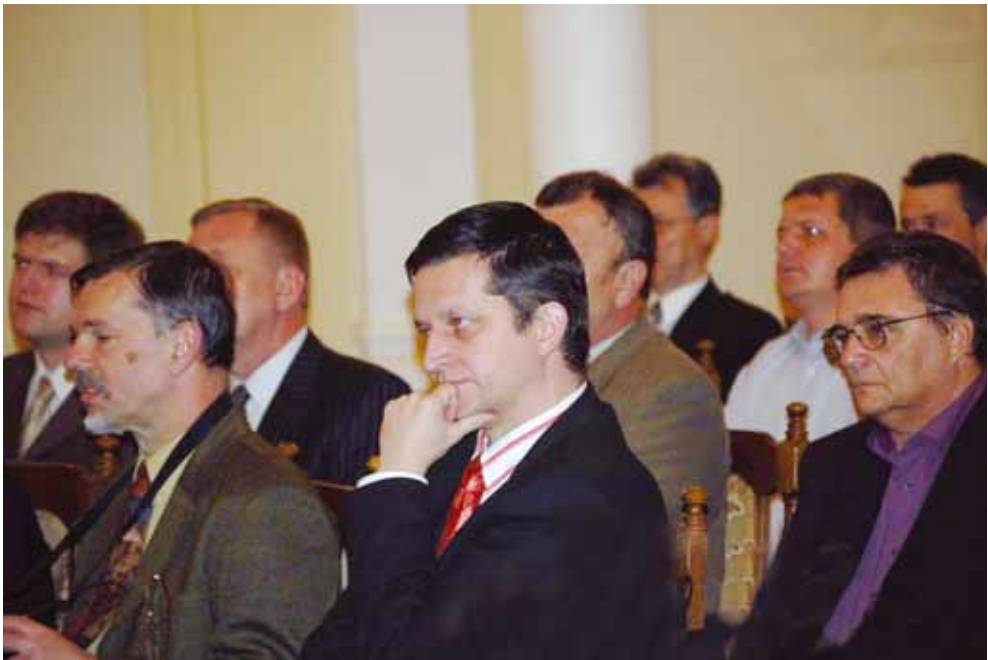
Gazdasági Konzultáció a határon túli vállalkozókkal, Révkomárom 2005. november 29.