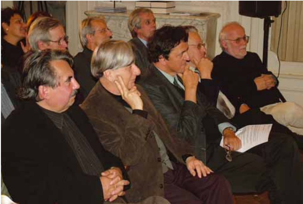
Gazdasági Konzultáció a Magyar Építész Kamarával, Budapest 2005. november 3.