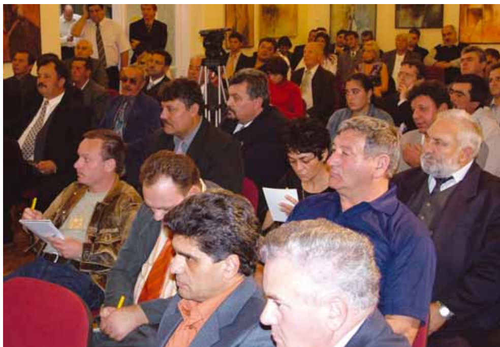
Gazdasági Konzultáció a roma vállalkozókkal, Szécsény, 2005. október 26.