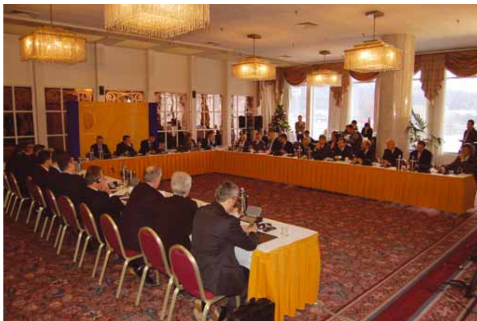
Gazdasági Konzultáció a nagyvállalatok vezetőivel, Budapest, 2005. december 8.