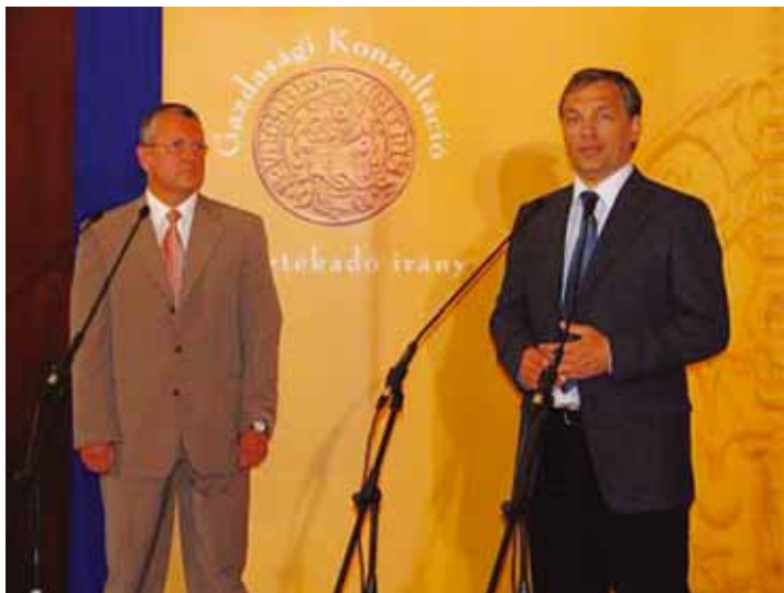
Elindult a Gazdasági Konzultáció, 2005. szeptember 14.

„A gazdasági konzultáció során a magyarországi gazdasági élet legfontosabb szereplőivel, szakemberekkel, kamarákkal, érdekképviselőkkel, külföldi befektetőkkel egyaránt szeretnénk tárgyalni a tervezett radikális adócsökkentés részletes kidolgozásáról és a 2006-ot követő évek munkabarátságpolitikájának kialakításáról.”