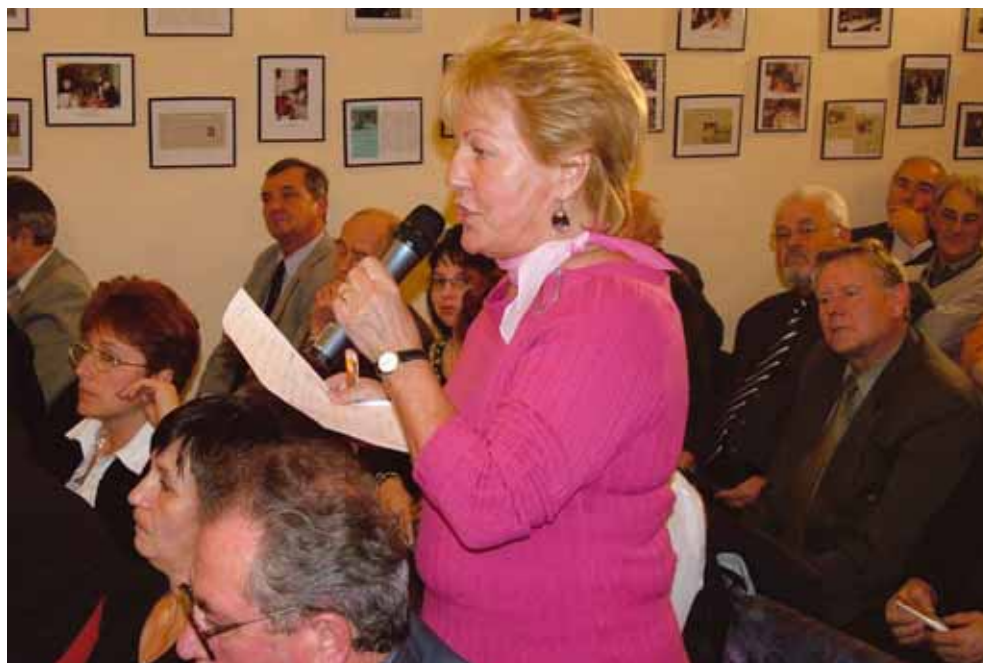
Gazdasági Konzultáció az Ipartestületek Országos Szövetségével (IPOSZ), Budapest 2005. november 9.