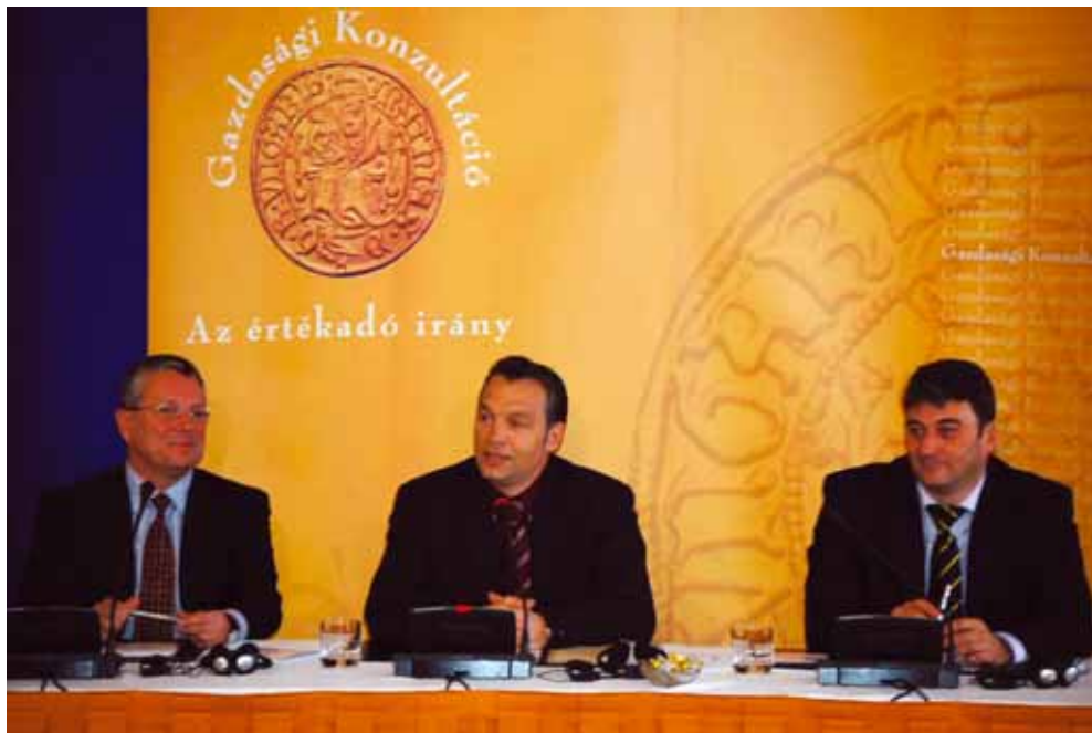
GAZDASÁGI KONZULTÁCIÓ 2005