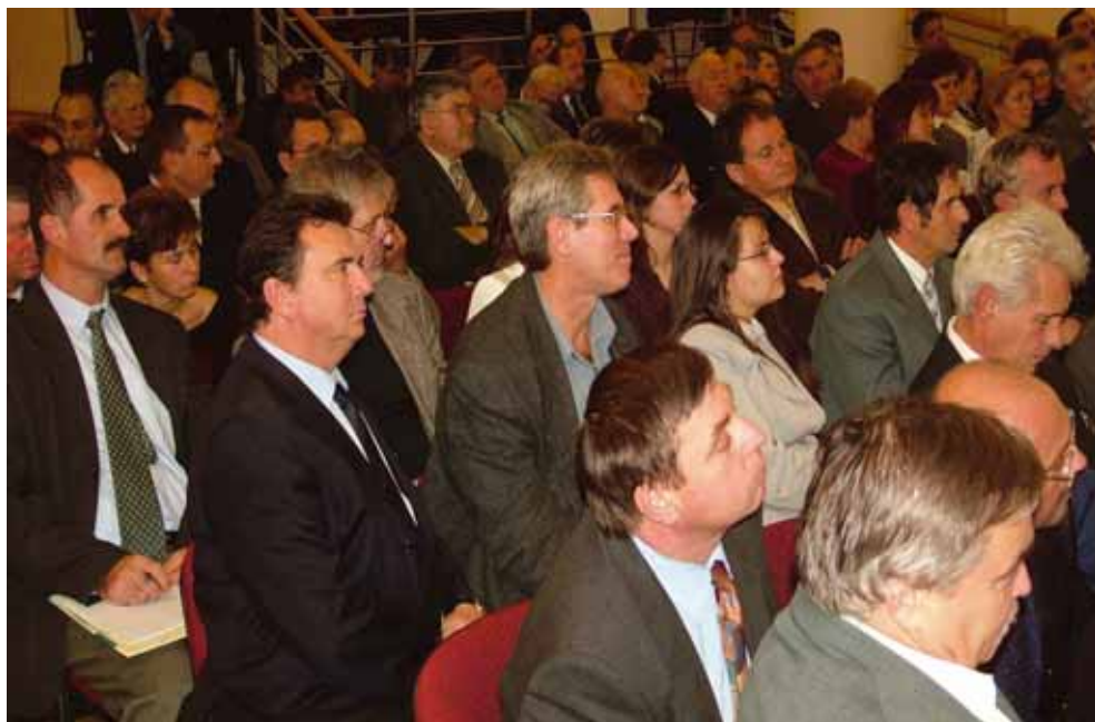
Gazdasági Konzultáció a Vállalkozók Országos Szövetségével (VOSZ), Budapest 2005. nov. 16.