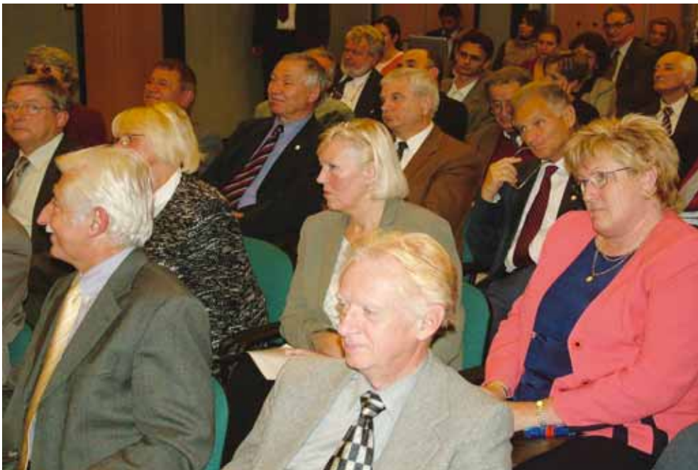
Gazdasági Konzultáció a Magyar Mérnök Kamara tagjaival, Budapest, 2005. november 10.